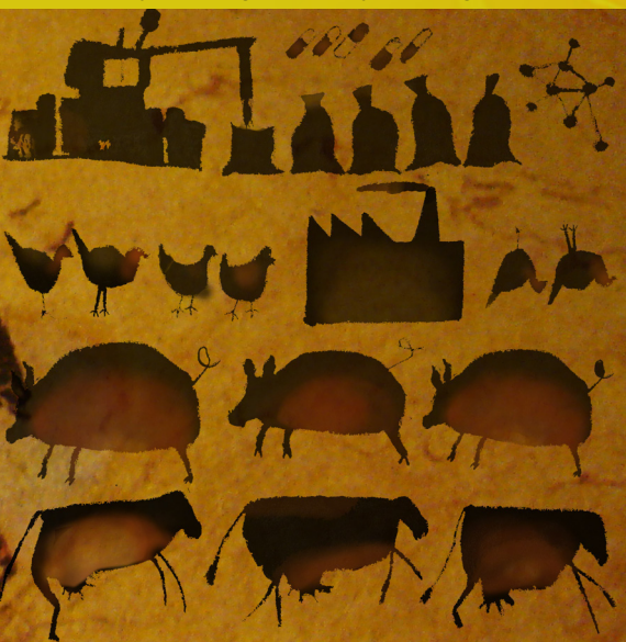
Todas las ilustraciones están creadas por Anna Loveday-Brown