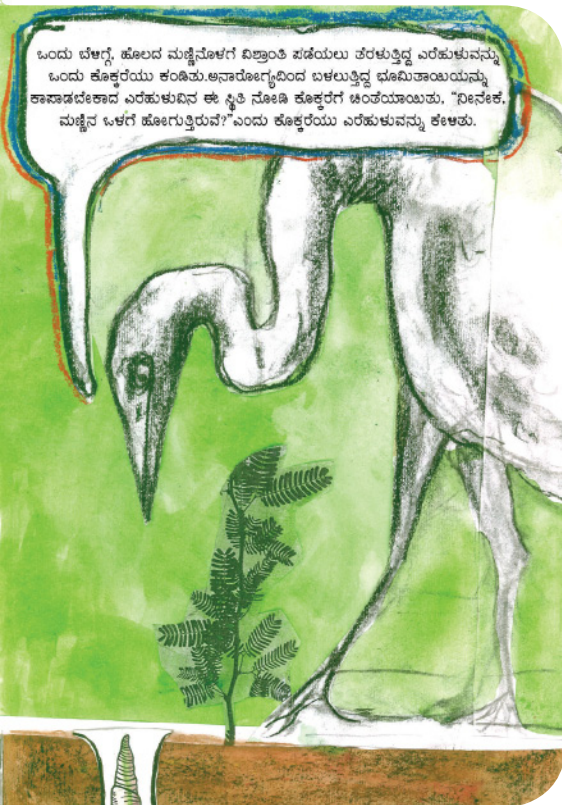
El libro Amrita Bhoomi de Ilustración sobre la agricultura natural

La idea es continuar con la arpillería porque es un arte muy bonito. Entre hilos y agujas, vamos charlando, hablando, contando. Cuando empezamos a hacer estas memorias ambientales descubrimos que nuestros muertos no eran gratis, que nuestros desplazados no eran los malos, que todo esto tenía un trasfondo que poco a poco descubrimos y hemos plasmado en los yutes. Vamos a seguir cociendo porque queremos hacer una memoria para la no repetición, una memoria de la paz. Nosotras luchamos por la paz y nuestras armas son un hilo y una aguja.