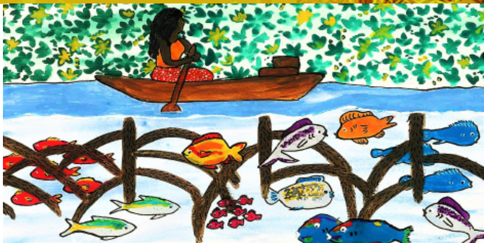
Ilustración de Cara Penton, @CaraPenton

Las Naciones Unidas ha declarado el año 2022 como el Año Internacional de la Pesca y la Acuicultura Artesanales (AIPAA 2022) para resaltar la importancia de la pesca y acuicultura artesanal.